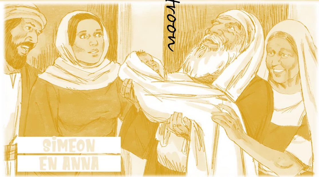
SIMEON EN ANNA